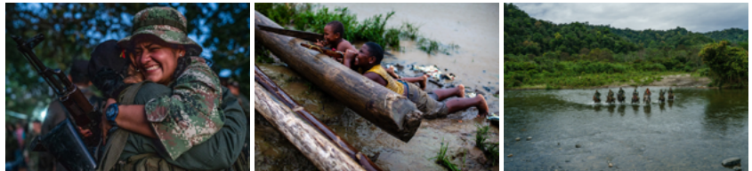
Federico Ríos / Verde

Es un conjunto de imágenes dispuestas para contar una historia. Un proyecto puede ser muy personal. Las historias que cuentan a menudo incluyen un significado más profundo que revela las pasiones, emociones e intereses del fotógrafo. La investigación es el primer paso para crear un proyecto fotográfico.