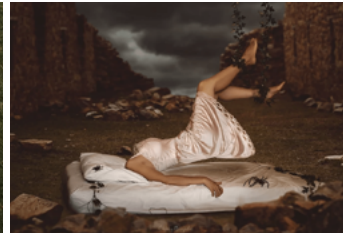
Cheeky Ingelosi Una chica llamada Depresión